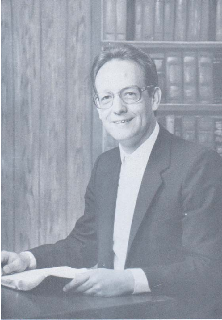
ब्रदर डानियल पापबाट मुक्त भएपछि (1983)